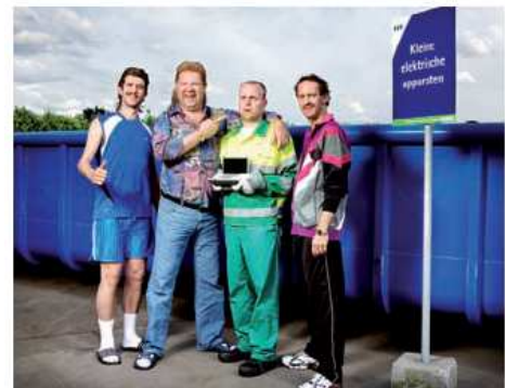
NVMP met hun 'Wecycle'-campagne